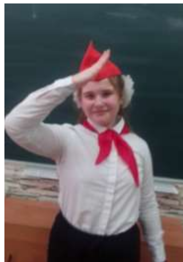
Стихотворение «КОНЦЕРТ» Роберт Рождественский